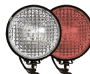
фары на СИМ